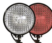
фары на СИМ